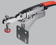
Vodorovný upínač STC-HA s úhlovou upínací deskou