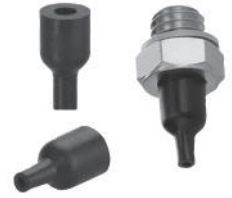
【适用于工件比较小、比较轻的场合】