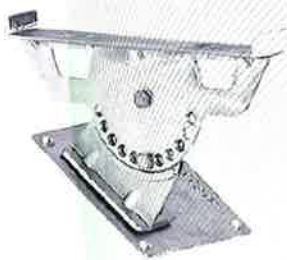
Bild 1: Laufstegstütze, Typ: FlatStep Laufrosthalterung (16000), zur Montage bei Schiefer- und Schindeldächern