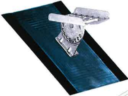
Bild 5: Steigtritt, Typ: FlatStep Steigtritt (02000), zur Montage bei Schiefer- und Schindel-dächer