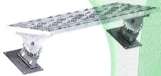
Bild 4: Trittfläche, Typ: FlatStep Langrost (08000), zur Montage bei Schiefer- und Schindel-dächer