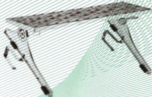
Bild 2: Trittfläche, Typ: SnapStep Langrost (38000), zur Montage bei Ton- und Betonpfannen