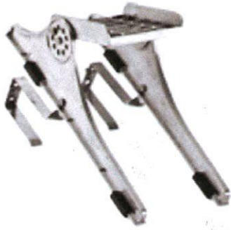
Bild 3: Steigtritt, Typ: SnapStep Steigtritt (30000), zur Montage bei Ton- und Betonpfannen