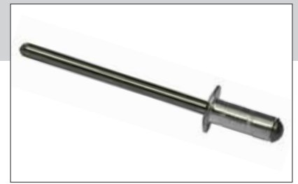
EN AW - 5052 [AlMg2,5]