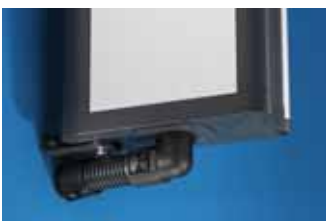
Montage an Compact-Panel CP 6340.000 - .420, siehe Seite 231