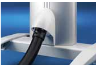
Montage an Standfuß CP 6141.100, siehe Seite 290